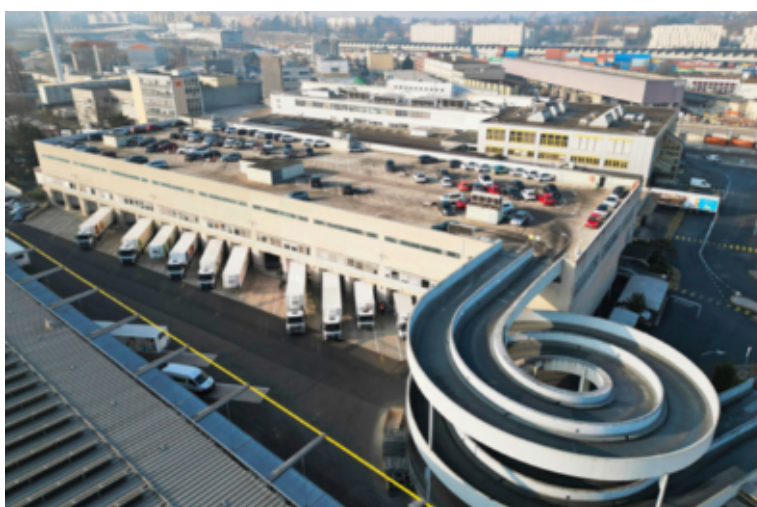
Vue aérienne de la centrale d'exploitation de Migros Genève à Carouge.

M.R.: Je représente les membres, participe aux négociations salariales et collabore étroitement avec la direction