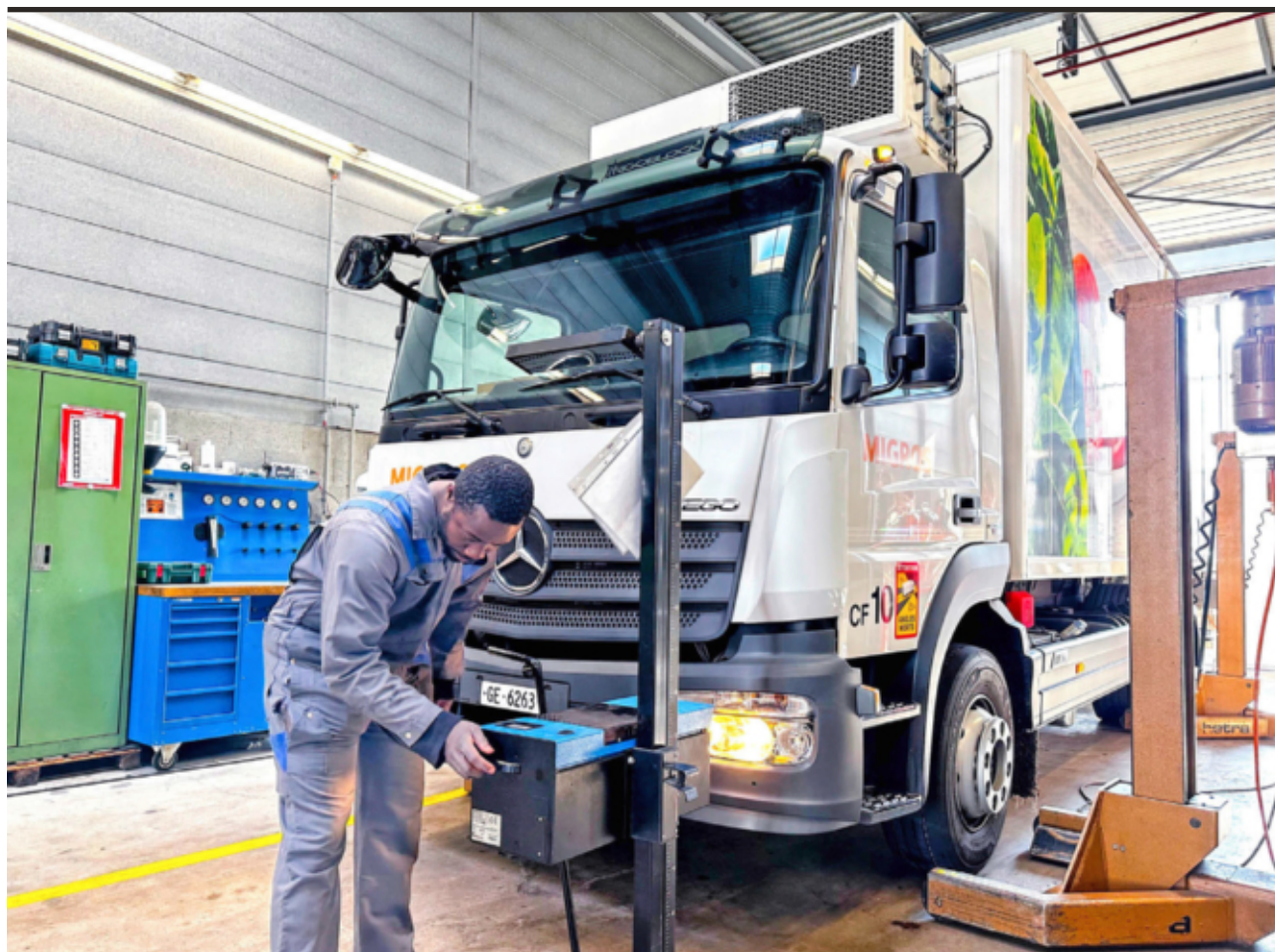
La polyvalence et les compétences des collaborateurs permettent de gérer la majorité des interventions à l'interne.