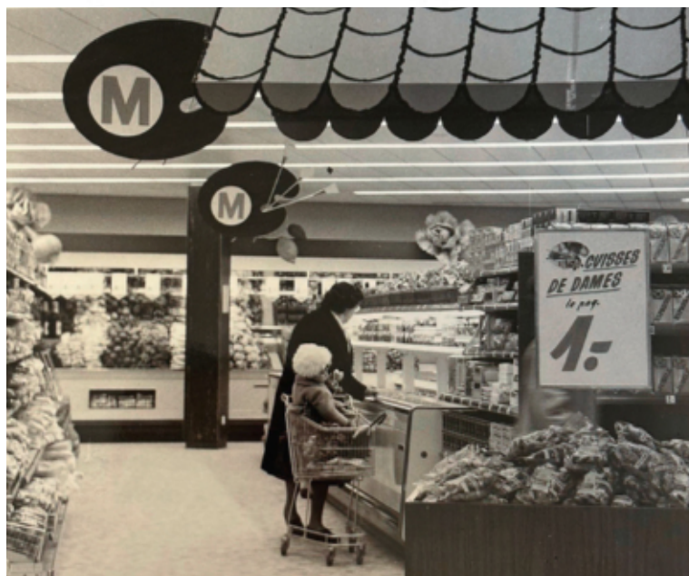
Photos d'archives du magasin Migros Palettes lors de ses premières années.

collègues sont amicaux et c'est très agréable de travailler dans cette atmosphère. Certains sont même devenus des amis que je vois volontiers en dehors du cadre du travail.